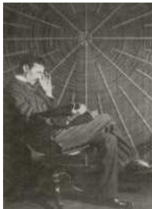
Tesla sitzt in seinem Labor vor einer gigantischen Tesla-Spule (1898).

Nikola Tesla wurde in eine Welt hinein geboren, die erst zu entdecken begann, dass es eine geheimnisvolle elektrische Kraft gibt, die man nutzen kann. Eine Welt, deren Nacht nur erhellt wurde vom Feuer im Kamin, von rußenden Öllampen und äußerst selten von flackernden Gaslaternen. Eine Welt, die bewegt wurde durch die Muskelkraft von Tieren, die Stetigkeit des Wassers und seit kurzem den gebändigten Wasserdampf.