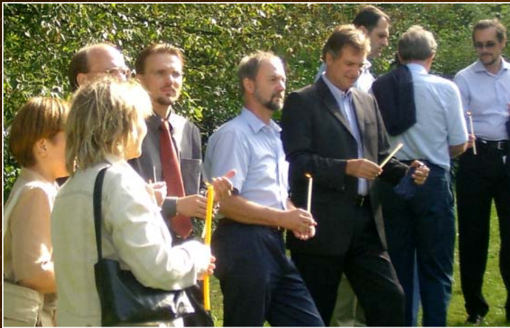
Ein Ort der Begegnung