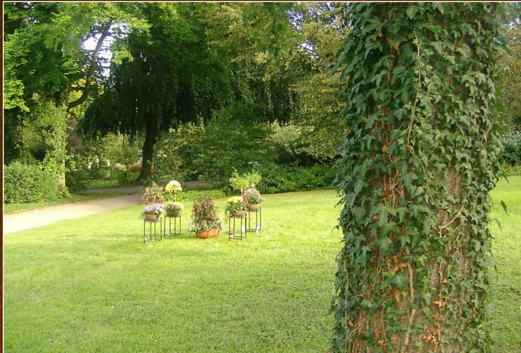
Vor 56 Jahren genau an dieser Stelle wurde Mileva Einstein-Marić vom russischen Erzpriester David Tschubov am 6.8.1948 um 16.30 beerdigt