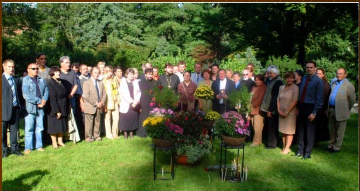
Das Grabfeld 9 mit der Nummer 9357 von Mileva Einstein-Marić