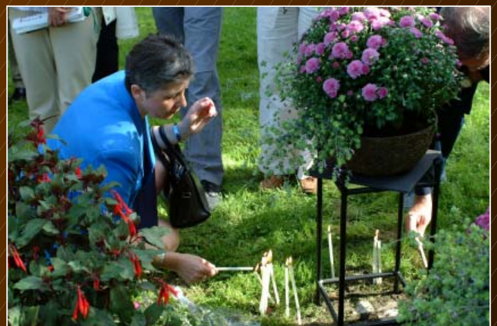
Ein würdiges Andenken, die Generalkonzulin von Serbien & Montenegro