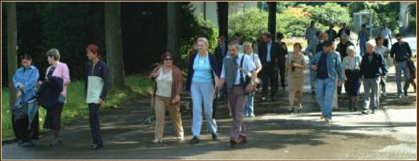
Ein historischer Weg vom Haupttor des züricher Nordheim Friedhofs in Richtung Milva Einstein-Marićs Grab