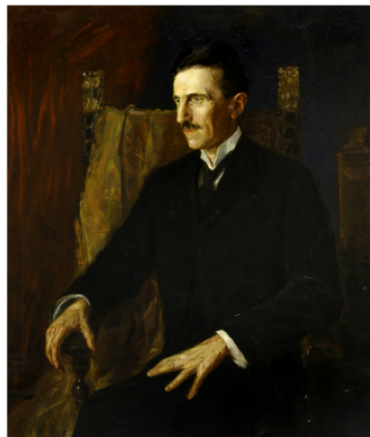
Abb. 3 Fotografie Tesla, Modern Mechanics , 1924 Abb. 4 V. Lwoff-Parlaghy: Blaues Porträt 1913 (Neuaufnahme Husum)

1934 erschien in der Zeitschrift Modern Mechanics and Invention ein umfangreicher Artikel Radio - Power Will Revolutionize the World von Alfred Albelli mit einem Porträtfoto Teslas. Albelli schilderte, wie sich Tesla die interstellare Telekommunikation vorstellte und eine drahtlose Energieübertragung für Flugzeuge mit Elektromotoren über nächtlich beleuchteten Städten. Der 78jährige Tesla selbst kam zu Wort über seine in den vergangenen fünfzig Jahren entwickelten Ideen und deren Realisierung in den kommenden fünfzig Jahren. Teslas Hauptziel war die drahtlose Übertragung von Energie und Information. Abgebildet war dazu ein ein neueres Modell eines