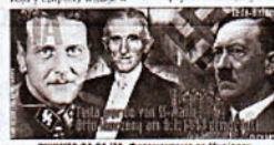
СВИЈЕТА СА СЛТА: ПОТОНУЛИ НА ШВАЈЦАРИЈИ

Михаел Краузе свог пријатеља Швајцару упитује и на своју књигу "Како је Тесла пронашао 20. столетје" у којој на страни 351 између осталог стоји: "Уједињени држави 1943. ликвидирали су Никола Теслу у Хитлеровој објектацији, јер је могао да развије једини систем рат" поново су околности. У Теслино музеевски да својим наукума ратни рат извршило се 1918. а Тесла да су га 1943. ликвидирали Хитлерови објектацији на челу са аустро-српским колективним Отом Skorzeny-ом извршило је поново протретила српским и српским медијима и српским медијима српских привредника.