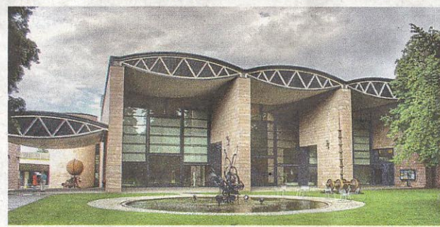
Muzej Tingueli u Bazelu