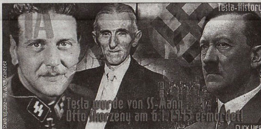
СКИНУТА СА САЈТА: Фотомонтажа по Шнајдеру