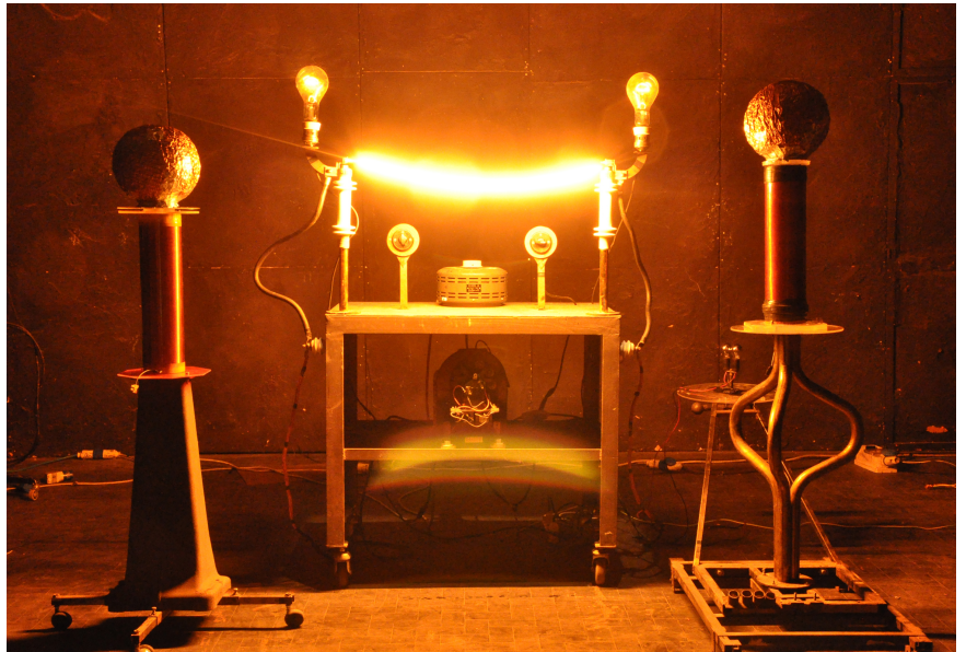
“Nikola Tesla. Lectures” 2013